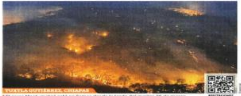
El cerro Maculmatz'a está en llamas desde la tarde del martes 26 de marzo.

El número de incendios forestales activos en el país se disparó en una semana, al pasar de 26 a 130 entre el 20 y el 27 de marzo.