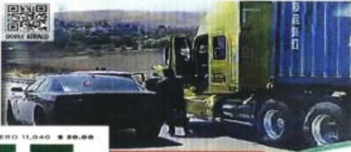
12-05 HRS. MEXICO-QUERETARO

'HALAGO' Y EXPULSIONES Javier Milei consideró un halago que AMLO lo critique. "Que un ignorante hable mal de mí, me enafeca", dijo; mientras que a Gustavo Petro, de Colombia, lo calificó de "asesino terrorista", lo que causó la expulsión de diplomáticos de Bogotá. PAG. 6 E INTER. (PAG. 15)