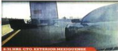
8:31 HRS. CTO. EXTERIOR MEXIQUENSE

ROBA MISMA BANDA DOS VECES EN 4 HORAS Dos tráileres que transportaban tecnología fueron asaltados con violencia en un lapso de menos de cuatro horas por la misma banda, primero en la Autopista México-Querétaro y luego en el Circuito Exterior Mexiquense. PÁGINA 2