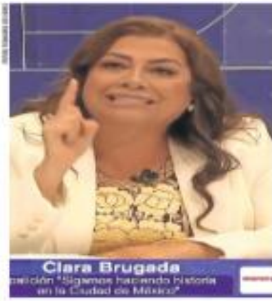
Clara Brugada Candidata "Sigamos haciendo historia en la Ciudad de México"