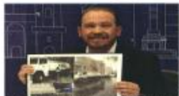
Taboada reclamó la escasez y venta de agua en la ciudad.