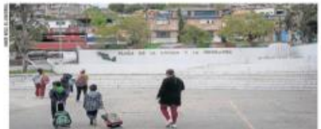
En el epicentro del asesinato en Lomas Taurinas se creó la Plaza de la Unidad y la República, donde se levanta un monumento de bronce de Luis Donaldo Colosio.