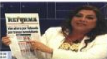
Brugada acusó al posista en encabezar el "Cártel Inmobiliario".

Reprocha parista devotos en Utopías; y Clara recuerda 'Cártel Inmobiliario'