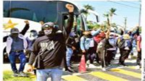
Decenas de normalistas con el rostro cubierto llegaron en camiones a la sede del Poder judicial federal en Acapulco.