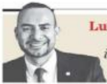
Luis Arriaga Valenzuela "Universidad e inteligencia artificial: el debate ético" - P. 14