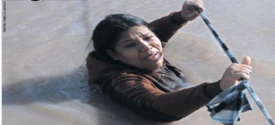
IMAGEN DEL DÍA CON EL AGUA AL CUELLO

Ciudad Juárez.— El nivel del río Bravo subió de manera considerable en los últimos días, luego de que el gobierno estadounidense abrió las compuertas para la entrega de agua que se hace cada año a México. Representa un nuevo problema para las decenas de migrantes que a diario cruzan esta frontera natural para llegar a Estados Unidos y ahora arriesgan la vida al avanzar colgados de una soga.