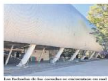
Las fachadas de las escuelas se encuentran en mal estado, debido a la falta de mantenimiento.

JOSÉ QUEZADA —quezad@eluniversal.com.mx El Centro Nacional de las Artes (Cenart), que este año cumple tres décadas, opera con una disminución presupuestaria. Para 2024 se le asignaron 196 millones 907 mil 276 pesos, 30 millones menos que en 2019. A este respecto, que para estudiantes, trabajadores y especialistas impacta en la infraestructura y desmorono académico, se narra la desaparición del fideicomiso que sirvió para su construcción.