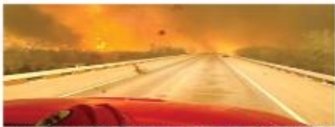
ZONAS CRÍTICAS, EL NORTE Y EL ESTE