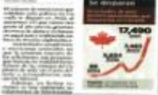
Las solicitudes de asilo a Canadá se separaron 133% en 2023.

asiste a la Cumbre de Líderes de América del Norte en Québec en abril si siente que el País no está recibiendo un "trato respetuoso". Anoche, la Cancillería de México emitió un comunicado en su cuenta oficial de redes sociales donde lamentaba la decisión de Ottawa.