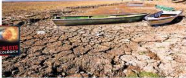
YA SE PERDIÓ 76% DEL EMBALSE MICHOACANO