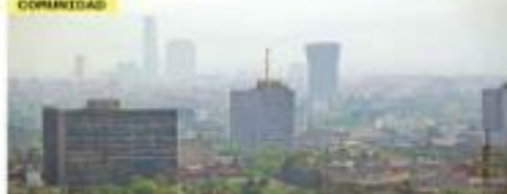
TERMÓMETRO MARCARÁ HASTA 38 GRADOS