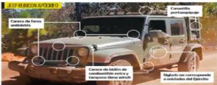
La autoridad militar señaló, a petición de este diario, las diferencias entre los vehículos de la Sedesra y los clones usados por Los Tlacos.