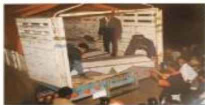
Fotografía de los 41 indígenas asesinados por paramilitares en Acteal.