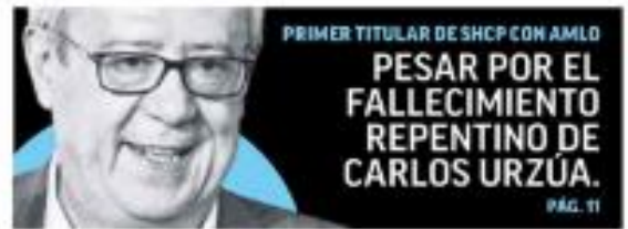
PRIMER TITULAR DE SHCP CON AMLO

EL CRIMEN ORGANIZADO TIENE EL CONTROL DE UN TERCIO DEL TERRITORIO. EN UN VIDEO DIO QUE ES NECESARIO ACABAR CON ESTE FLAGELLO QUE DAÑA A LOS MEXICANOS. PÁG. 34