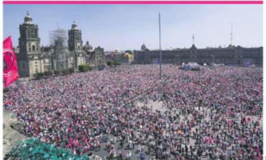
¡La ley sí es la ley! ¡Que nos cuenten bien! ¡Ahora somos 700 mil, se escuchaba al micrófono y entre gritos.

PIDEN QUE NO HAYA UN REGRESO AUTORITARIO