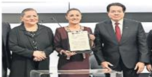
Guadalupe Tzucel, consejera presidenta del INE, y Mario Delgado, dirigente nacional de Morena, estuvieron presentes durante el acto protocolario.