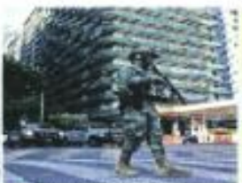
Agentes de la Marina participaron en los operativos, donde un departamento fue asegurado por la FGR.