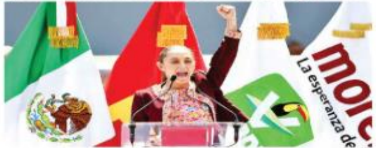
Claudia Sheinbaum dijo que buscará seguir construyendo un México justo, libre, fraterno y democrático.

"Extendemos nuestra mano y convocamos a todas y todos los sectores, clases