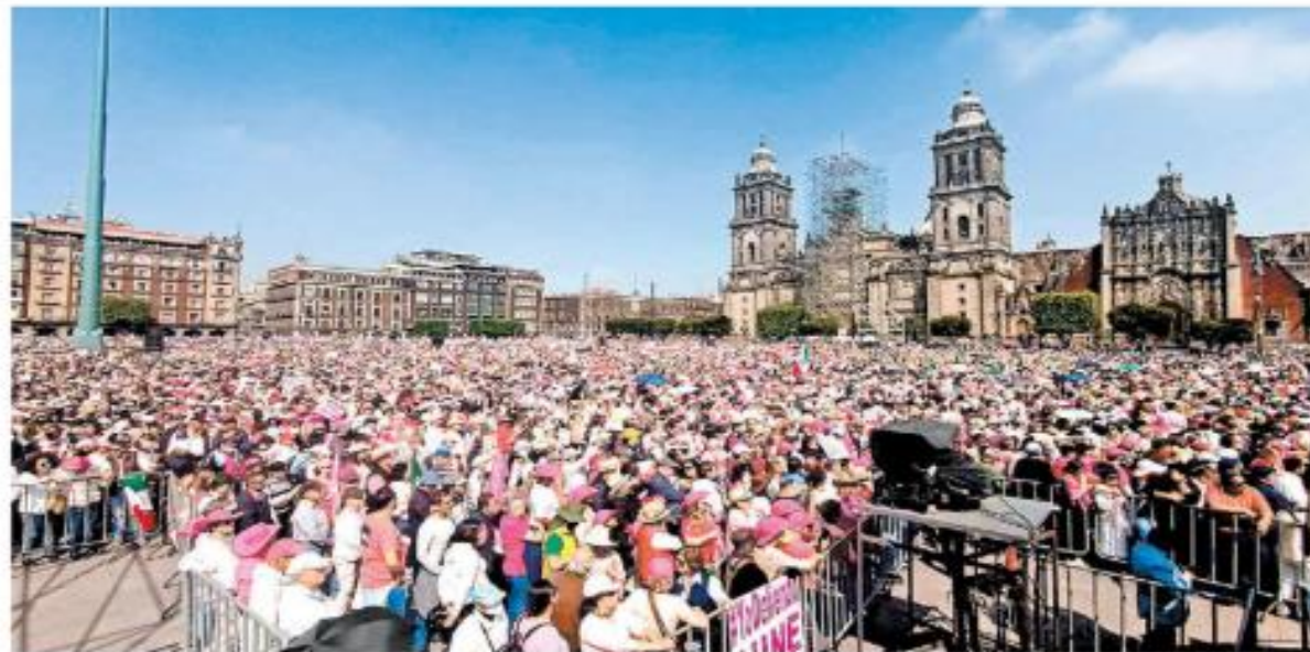
El gobierno de CdMx cifró en 90 mil el número de asistentes al Zócalo, mientras los organizadores hablaron de 700 mil. ARIANA PÉREZ