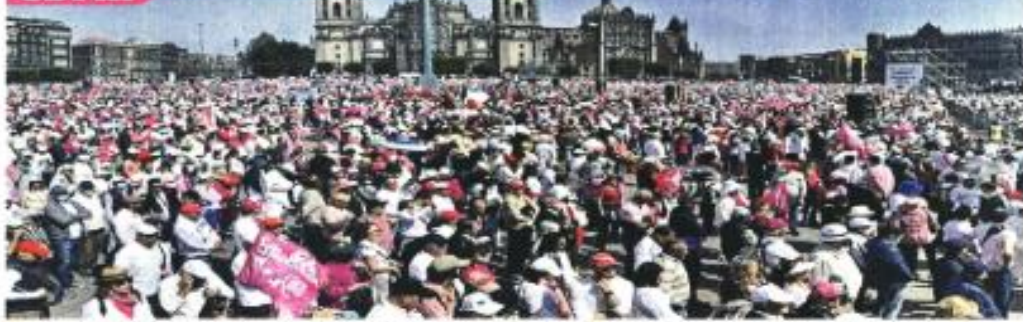
La Marcha por la Democracia convocó a miles de personas en 100 ciudades de México y 20 puntos de 7 países en el mundo.