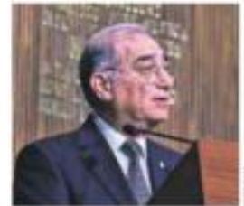
En Querétaro. Rechaza ministro propuesta de AMLO de reforma judicial.

TRANSPORTISTAS CONVOCAN A OTRA MARCHA PARA EL 15 DE FEBRERO POR INSEGURIDAD, EXTORSIONES Y ABUSOS. PÁG. 18