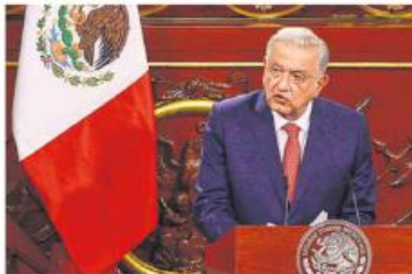
Oportunidad histórica. Los cambios son para revertir aculteraciones, dice.