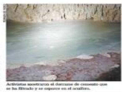
Activistas mostraron el derrame de cemento que se ha filtrado y se espesa en el acuífero.