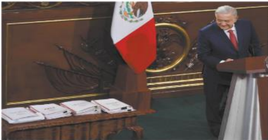
El presidente Andrés Manuel López Obrador observa las carpetas en las que plasmó sus 20 propuestas de reforma para acabar con la aprobada en los gobiernos neoliberales y que presentó ayer en el Hemiciclo Parlamentario ubicado en Palacio Nacional.

La oposición se mostró dispuesta a analizar las reformas, pero adelantó que no apoyará las que debiliten la democracia o disminuyan los órganos autónomos o al Poder Judicial. Por su parte, el ministro Alberto Pérez Dayán, a quien se arrojó que nadie está por encima de la Constitución. Redacción | NACIÓN | A4 Y A5