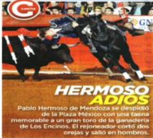
HERMOSO ADIOS Pablo Hermoso de Mendoza se despidió de la Plaza México con una faena memorable a un gran toro de la ganadería de Los Encinos. El rejoneador cortó dos orejas y salió en hombros.

Somete narco a Chilpancingo El crimen organizado asesino ayer a cuatro choferes del transporte público; en protesta, el servicio fue suspendido. PÁG. 2