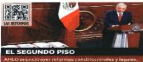
EL SEGUNDO PISO AMLO anunció ayer reformas constitucionales y legales.

Eso incluye a los adultos mayores de 60 años, la universalización para discapacitados, becas para estudiantes pobres de todos los niveles educativos, un año de salario a jóvenes aprendices, depositos a jornaleros agrícolas, precios de garantía y entrega