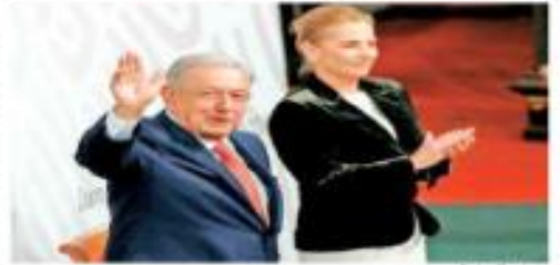
En la presentación de las reformas, el Presidente López Obrador estuvo acompañado de su esposa, la secretaria Beatriz Gutiérrez Muller.