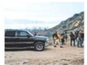
Servicio exclusivo, ESPECIAL

El candidato republicano llamó a su partido a rechazar el acuerdo de voto migratorio por ayuda para Ucrania. PÁG. 11