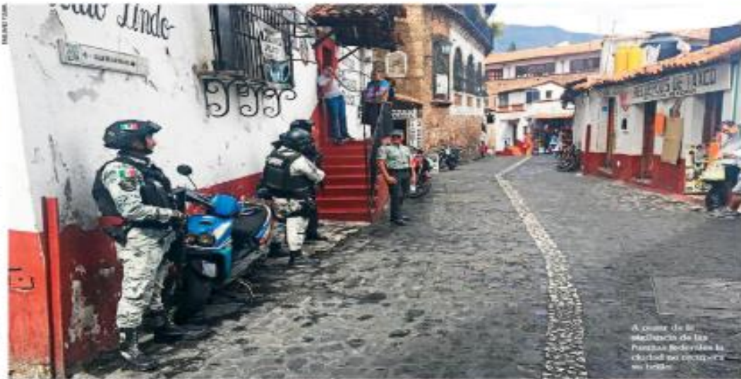
A causa de la inhabilitación de las elecciones, autoridades en la ciudad se concentran en la vida.