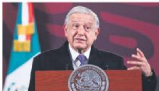
Reciben 800 mil pesos. El pueblo está manteniendo a verdugos en el PF.

EXAMINAN A MÉXICO Alertan en Consejo de DH de ONU por desapariciones, ataques a prensa y militarización.