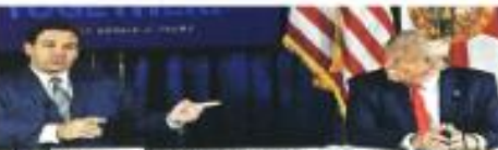
Para Ron DeSantis, Trump será la apuesta republicana.

En un juego con cinco volteretas en el marcador, Chiefs se impuso a Bills 27 a 24 cuando el pateador de Buffalo falló un intento de gol de campo de 44 yardas con 1:47 en el reloj.