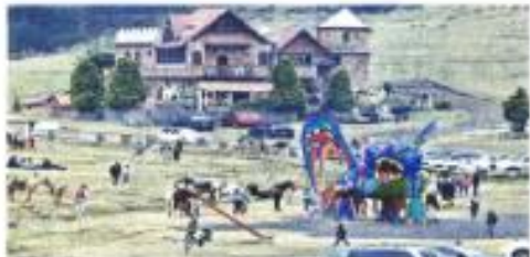
Zona del ataque de ejidatarios contra turistas.

"Aquí vemos empresas tradicionales y esto de alguna manera no despierta el interés de inversionistas, ni locales ni internacionales. Muestra no hay sectores con actividades que sean más innovadoras, más disruptivas, el mercado mexicano se va a seguir comportando de la misma manera", añadió.