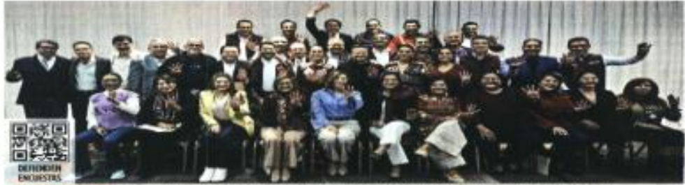
FLANA MAYOR. Gobernadores y líderes de Morena acudieron al Consejo Nacional en el que Claudia Sheinbaum fue confirmada como candidata presidencial.

Incluso locatarios negaron conocer a los agresores. Ayer había visitantes comiendo o realizando actividades recreativas, pero la zona no se veía llena como habitualmente está en fin de semana. Algunos afirmaron haberse percatado de la presencia policial y dijeron sentirse seguros. La Secretaría de Seguridad del Estado informó que intervino la presencia de agentes en días de alta afluencia para garantizar un entorno seguro a los turistas, tras lo que la fiscalía confirmó que ya investiga la agresión.