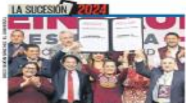
"LA DERECHA, SIN PROYECTO": CLAUDIA | NACIÓN | A8