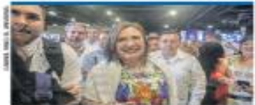
XOCHITL: "CONTINUARÁ EL TREN MAYA" | NACIÓN | A8