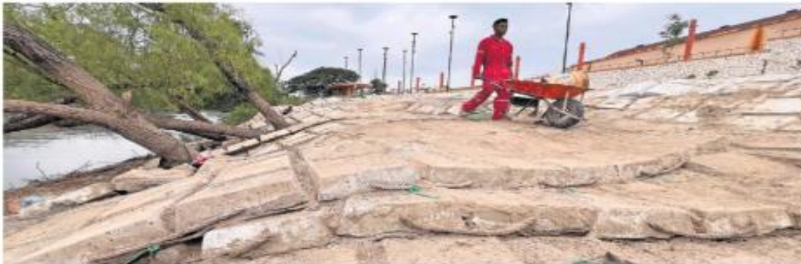
El malecón Carlos A. Madrazo de Villahermosa, Tabasco, se empezó a reconstruir en 2022 y, aunque todavía no ha sido terminado, ya presenta deficiencias.