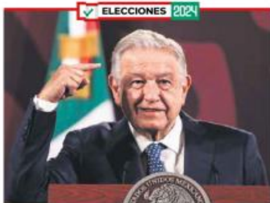
Retiro completo. “No quiero ser líder máxima, ni caudillo, ni cacique”.

“Imagínense mil millones, por qué esos mil millones no van a pensiones”. Sin embargo, expertos dijeron que el planteamiento es inviable, pues el presupuesto del INAI no sería suficiente para pagar las pensiones. —Diana Rentería / PÁG. 28