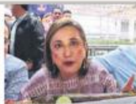
XÓCHITL GÁLVEZ PRESIONA A SHEINBAUM PARA QUE CONTESTE SOBRE RETO A DEBATIR. NO SUS VOCEROS. PÁG. 31