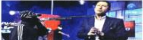
El Fiscal investigaba la irrupción de hombres armados en un canal de televisión el pasado 5 de enero.

En una entrevista el martes pasado con el diario ecuatoriano El Universo, Suárez dijo que no contaba con investigación, pese a que días antes había interrogado a los 13 detenidos por la in-