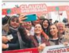
CLAUDIA SHEINBAUM RECHAZA QUE LA 4T SEA UN RÉGIMEN AUTORITARIO. CREA OPOSICIÓN NUEVA. NARRATIVA. PÁG. 31