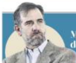
LORENZO CÓRDOVA Más allá de partidos, defenderá marcha la democracia. PÁG. 29