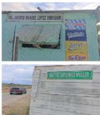
Hasta a la esposa del Primer Mandatario le llevó una calle que lleva su nombre.