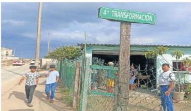
No sólo el presidente Andrés Manuel López Obrador, sino incluso el movimiento político que él mismo impulsa, la Cuarta Transformación, ya tienen una calle con sus nombres.