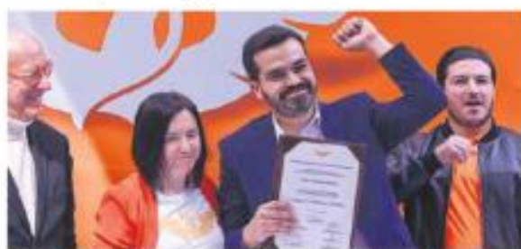
Precandidato naranja. Álvarez Máynez se niega a responderle al gobernador jalisco.