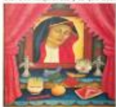
MARIA IGZQUIERDO (1902 - 1984) Año natural: 1902, Durango (1914) Coleccionista A.C. Cruz Nueva Vida A.C.