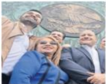
Jorge Álvarez Máynez y Enrique Alfaro, cuando en MC todo era miel sobre hojuelas.

Alfaro se inconforma con MC por poner a Máynez como su presidencial