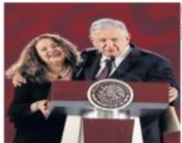
Se acuchilan los tiempos de almuerzo y merienda entre Sarahana Martínez y López Obrador.

Chocan en Morena por la acusación de Sanjuana de moches para Sheinbaum