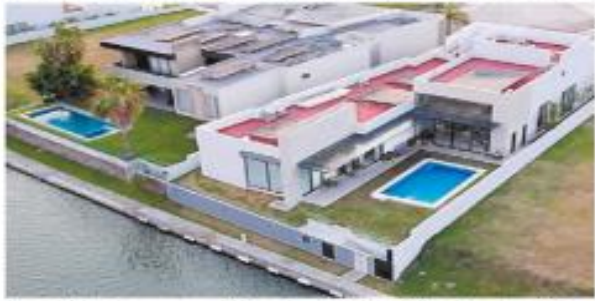
La cuatibela vive en una casa del lujoso fraccionamiento El Dorado, en Boca del Río.

Es imposible que la exsecretaria de Energía haya construido ese patrimonio en tan corto tiempo; hay inconsistencias entre el valor que declara y el del mercado: experto anticorrupción