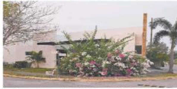
Una de sus propiedades se ubica en el fraccionamiento El Country, en Tlalisco.