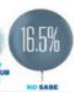
GRÁFICO: ALEJANDRO OYERVIDES

NUEVA ERA / AÑO. 7 / NO. 2501 / VIERNES 19 DE ABRIL DE 2024