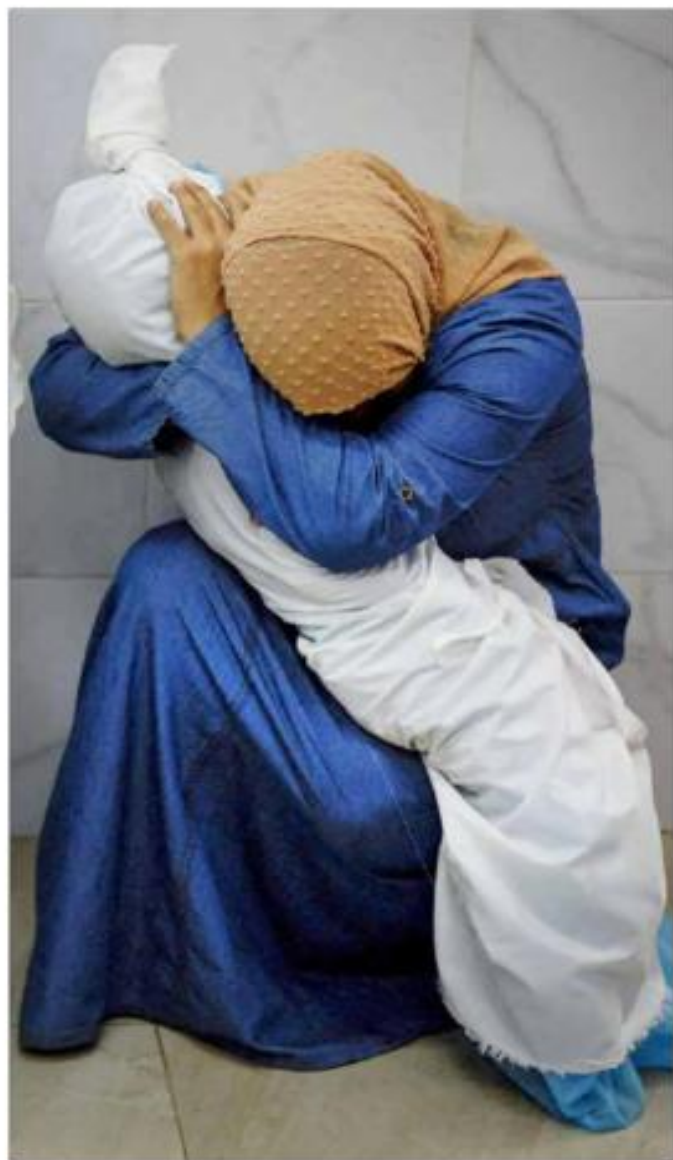
▲ Esta imagen, captada por Mohammed Salem, de la agencia Reuters, obtuvo el premio World Press Photo del año. En ella, una mujer palestina abraza el cadáver de su sobrina en el hospital Nasser, en Gaza, víctima de los bombardeos de Israel.

VIERNES 19 DE ABRIL DE 2024 // CIUDAD DE MÉXICO // AÑO 40 // NÚMERO 14281 // Precio 10 pesos