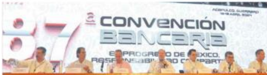
Acapulco. Los banqueros mantienen optimismo sobre el futuro económico del país por la 'gran oportunidad' del nearshoring

—F. Guadín/A. Martínez/J. Leyva / PÁG. 4