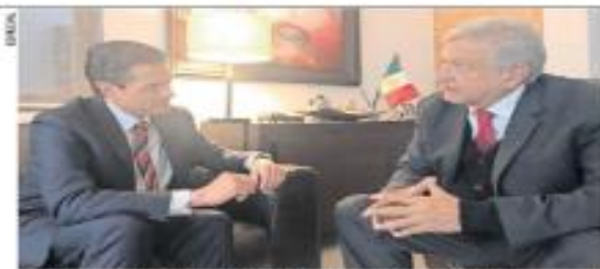
El encuentro se realizó en la casa de López Obrador en Toluca.