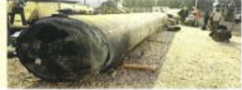
Es la primera respuesta de Irán al ataque de Irán del pasado 14 de abril.

MUESTRAN RESTOS DE EXPLOSIVOS EMILIA MARTÍNEZ / ENVIADA INTERNACIONAL (PÁGINA 14)