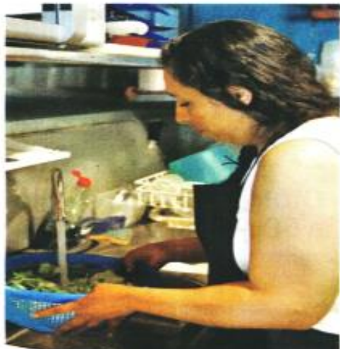
■ Negocios pierden clientes por el riesgo que representa el agua contaminada en colonias de Benito Juárez.