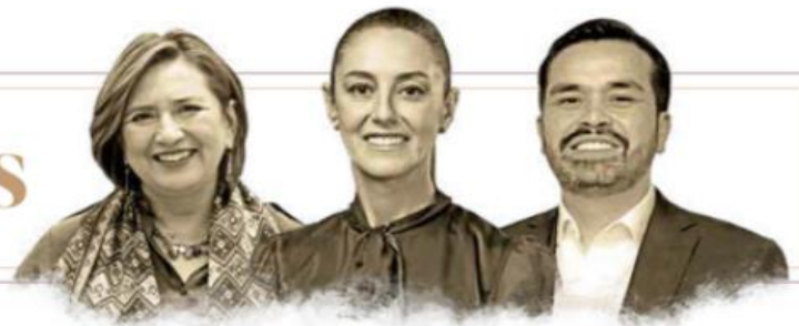
ILUSTRACIÓN: IVAN BARBERA

NUEVA ERA / AÑO. 7 / NO. 2498 / MARTES 16 DE ABRIL DE 2024