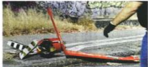
■ Peritos determinaron que el helicóptero que se desplomó el domingo tuvo una fuga de combustible.

Refirió que ya tienen los certificados médicos de los tres cadáveres y los resultados de los dictámenes forenses confirmaron que se trata de dos hombres y una mujer. Según fuentes extrajudiciales, los coreanos eran dos