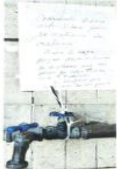
■ Advertencia a vecinos.

El Sistema de Aguas de la CDMX (Sacsmex) agrego que ha entregado a la ciudad