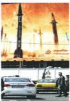
CRISIS ISRAEL-IRÁN Escriben sobre el tema General Lozano (Pág. 9) • Brinda Estéfani (Pág. 13)

El Fondo de Pensiones para el Bienestar, explicó, se conformaría con los recursos de las cuentas inactivas, con las utilidades que generan empresas parastatales como el Tren Maya y el Aeropuerto Internacional Felipe Ángeles.