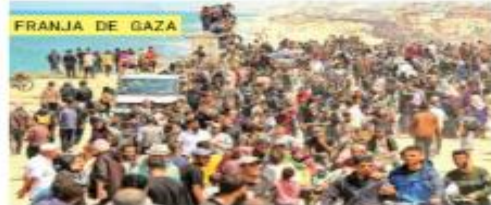
Miles de palestinos que intentaban volver a sus casas, en el norte de la Franja de Gaza, fueron atacados por Israel. En tanto, en la capital israelí se puede observar un grafiti de Joe Biden como superhéroe.