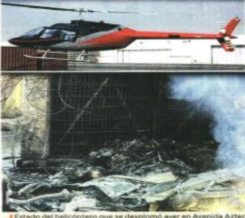
El estado del helicóptero que se desplomó ayer en Avenida Aztecas.

Líderes de los países del G7 y la ONU condenaron el ataque de Irán a Israel, y abogaron por el cese inmediato de hostilidades en la región. "Con sus acciones, Irán dio un paso más hacia la destabilización de la región y corre el riesgo de provocar una escalada regional incontrolable. Esto debe evitarse", manifestaron, en una declaración conjunta, los líderes de Italia, Alemania, Reino Unido, Estados Unidos, Japón, Alemania y Canadá. El Secretario General de la ONU, António Guterres, pidió a todas las partes involucradas que ejerzan la máxima moderación. "Ni la región ni el mundo pueden permitirse otra guerra", planteó. El Presidente de EU, Joe Biden, anunció que no apoyará una resolución que se refiera al Primer Ministro de Israel, Benjamin Netanyahu, decide tomar represalias. John Kirby, portavoz de seguridad nacional de la Casa Blanca, reveló que el mandatario estadounidense dejó "muy claro" al Premier israelí "que tenemos que pensar cuidadosa y estratégicamente" sobre los riesgos de que el conflicto se extienda.