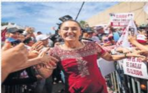
De campaña en Los Mochis, Sinaloa, Claudia Sheinbaum criticó al INE por no facilitar el voto de los mexicanos en el extranjero, para quienes dijo que el proceso resulta tortuoso.