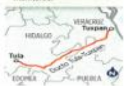
transporte del hidrocarburo".