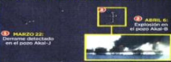
3 MARZO 22: Derrame detectado en el pozo Akal-J

Organizaciones ambientales denunciaron un nuevo derrame de Pemex en la Sonda de Campeche. Una gran mancha fue detectada desde el 22 de marzo y el 6 de abril, ocurrió una explosión en la plataforma Akal-B que dejó un muerto y 13 heridos. Se calcula que el derrame tiene una extensión de 390 km², similar al de julio pasado.