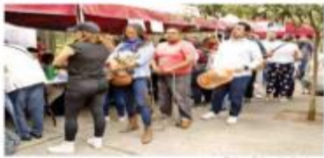
Los posibilitadores empezaron a funcionar anoche, pero desde antes vecinos hacían fila en coros latos para conseguir agua.