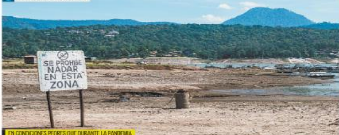
EN CONDICIONES PEDRES QUE DURANTE LA PANDEMIA