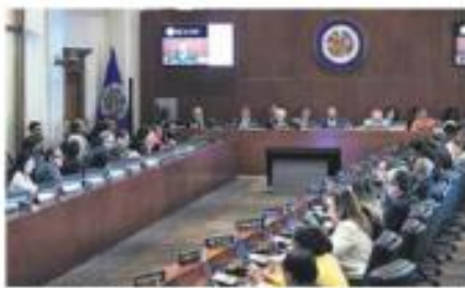
Resolución. Ecuador votó en contra y El Salvador se abstuvo.

La Organización de los Estados Americanos (OEA) aprobó una resolución que condena "enérgicamente" la incursión de la policía ecuatoriana en la embajada mexicana en Quito y los actos de violencia en contra del personal diplomático de la misión. La resolución, presentada por la delegación de Colombia, fue aprobada con el voto favorable de 29 países. México no estuvo presente en la sesión extraordinaria. —Pedro Rivarri / PÁG. 33