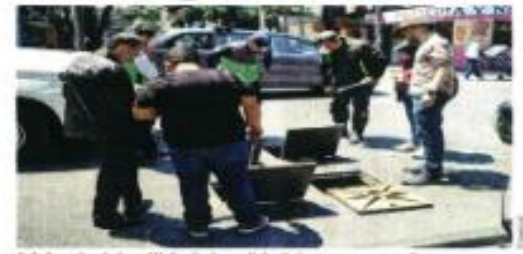
Además del análisis de la calidad de agua, se realiza desazolve del drenaje.

La Secretaría de Salud para atender a los vecinos afectados.