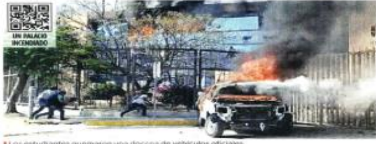
Los estudiantes quemaron una docena de vehículos oficiales.

La Gobernadora ya no llegó al evento. Un total de 13 vehículos fueron incendiados, 12 en el