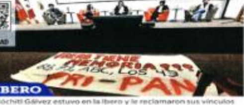
Xóchitl Gálvez estuvo en la Ibero y le reclamaron sus vínculos con priistas y panistas.