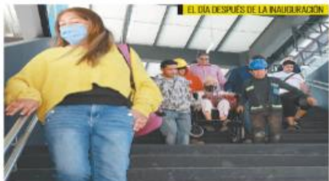
EL DÍA DESPUÉS DE LA INAUGURACIÓN