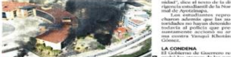
También lanzaron bombas molotov y provocaron incendios en las oficinas del Palacio de Gobierno de Guerrero.

estacionamiento y otro en el acceso principal del Palacio.