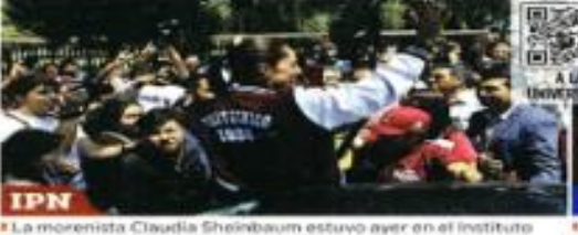
La morenista Claudia Sheinbaum estuvo ayer en el Instituto Politécnico Nacional.