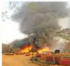
Fuente: Testimonios de la Guardia Nacional arribó al lugar en persecución del grupo armado, suscribiéndose

un fuerte enfrentamiento entre ambas partes, colocando a la población en medio del fuego cruzado, vulnerando el derecho a la vida e integridad por el uso desproporcionado de la fuerza”, afirmó.