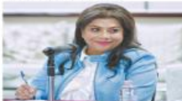
TECNÓLOGO EL UNIVERSAL

Llamó al Instituto Electoral a que juegue un papel neutral y se dijo confiada en que habrá una reconfiguración del mapa político de la ciudad con el triunfo de Morena en las 16 alcaldías. | A7 |