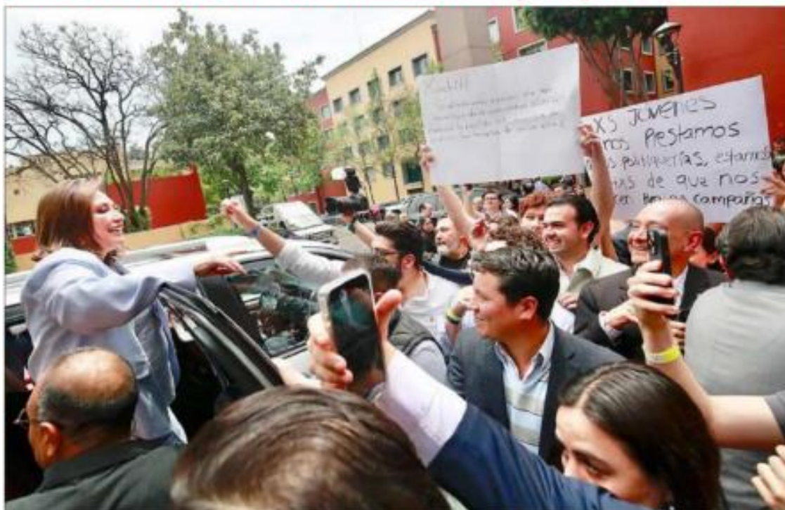
▲ La candidata de la coalición de PAN, PRI y PRD fue cuestionada por estudiantes de la institución por la falta de “coherencia ideológica” de las fuerzas políticas que la impulsan. También le recordaron que no siempre ha estado en favor de los derechos humanos, de las mujeres