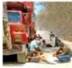
Videos difundidos en redes sociales mostraron a civiles que se resguardaban de la balacera y sus incendios.

Pobladores aseguraron que un grupo de 40 personas que esperaba el shalán para cruzar la presa La Angostura quedó entre el fuego cruzado. Entre ellos había