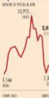
Inspección realizadas | MILES DE INSPECCIONES