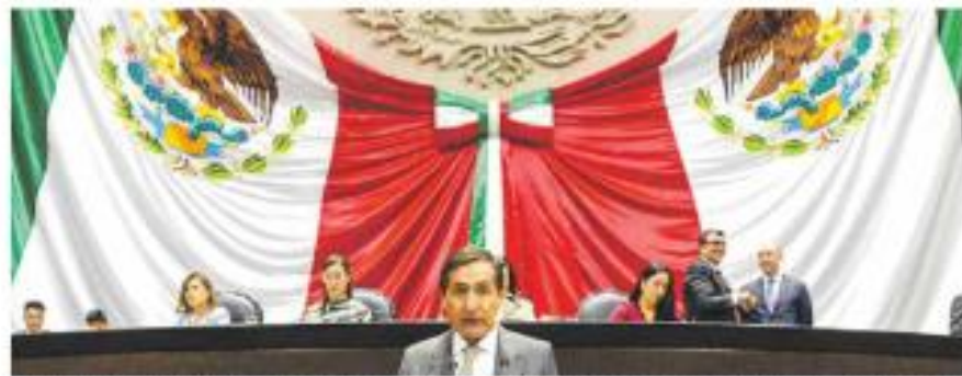
Comparecencia. El secretario de Hacienda dijo a diputados que la economía ya está 4.2% por arriba del nivel prepandémico.