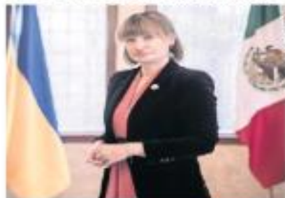
| MUNDO | A18

NO INVITAR A UCRANIA AL DESFILE MUESTRA EL APOYO A PUTIN, ACUSA