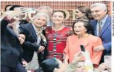
Cárdenas se reunió con autoridades de México, DF y Estado de Veracruz, para discutir la ley.