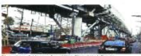
Las obras del tramo Zapotitlán-Nopalera fallaron.

Omar García Harfuch llegó escoltado por agentes y vehículos especiales de la Secretaría de Seguridad Ciudadana para desplazarse oficialmente como presidente de Morelos a la Jefatura de Gobierno de la CDMX. El ex jefe de la Policía realizó el anuncio en un salón de un hotel en Venustiano Carranza, rodeado de representantes del Partido Acción Nacional y líderes de movimientos y partidos políticos y medios de comunicación. Después su gestión al frente de la SSC y sus años en el "proyecto humanista" de su ex jefe, Claudio Sheinbaum