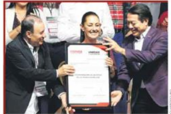
Piden apoyarla sin 'regateos', inicia 'gira' el domingo 17 de septiembre.