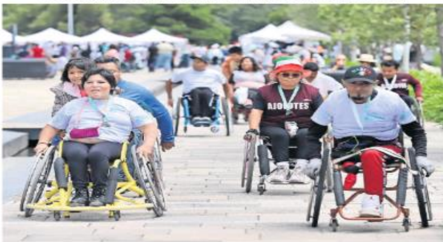
IMAGEN DEL DÍA CORREDORES EN SILLA DE RUEDAS

Más de 200 personas con discapacidad motriz participaron, en silla de ruedas o muletas, en la primera edición de la rodada incluyente Capaces 2023, que se realizó en el parque La Mexicana, en la alcaldía Cuajimalpa. Los asistentes dijeron sentirse motivados por formar parte de este tipo de eventos. Las autoridades de la demarcación buscan mejorar las condiciones de movilidad de ese sector. | A17 |