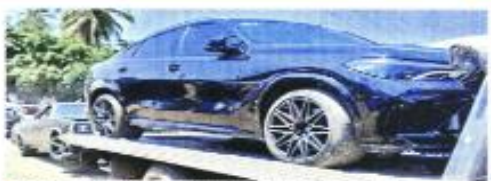
El Corolla sigue los pasos al cártel de "La Familia" y les había decomisado casas y autos de lujo.

Según la analista, esto presionará también a la siguiente Administración.