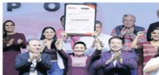
Claudia Sheinbaum levanta la construcción, redonda de dirigentes y legisladores necesarios que avancen el evento.

Exhorta a dirigentes y militantes a ir por “el carro completo” en 2024