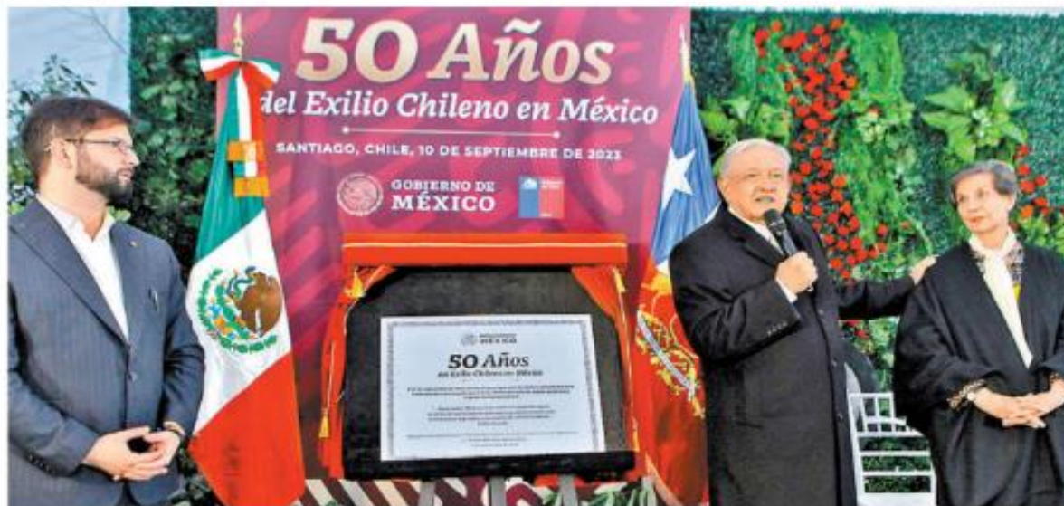
López Obrador, flanqueado por el mandatario de Chile, Gabriel Boric, e Isabel Allende, hija del ex presidente asesinado.