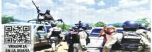
Atacan con drones

Grupos de autodefensas que se alistaban para tomar el control de "La Ruana" en Buenavista, Michoacán, fueron atacados por integrantes del Cártel de Jalisco Nueva Generación (CJNG) con drones con explosivos. PÁGINA 3