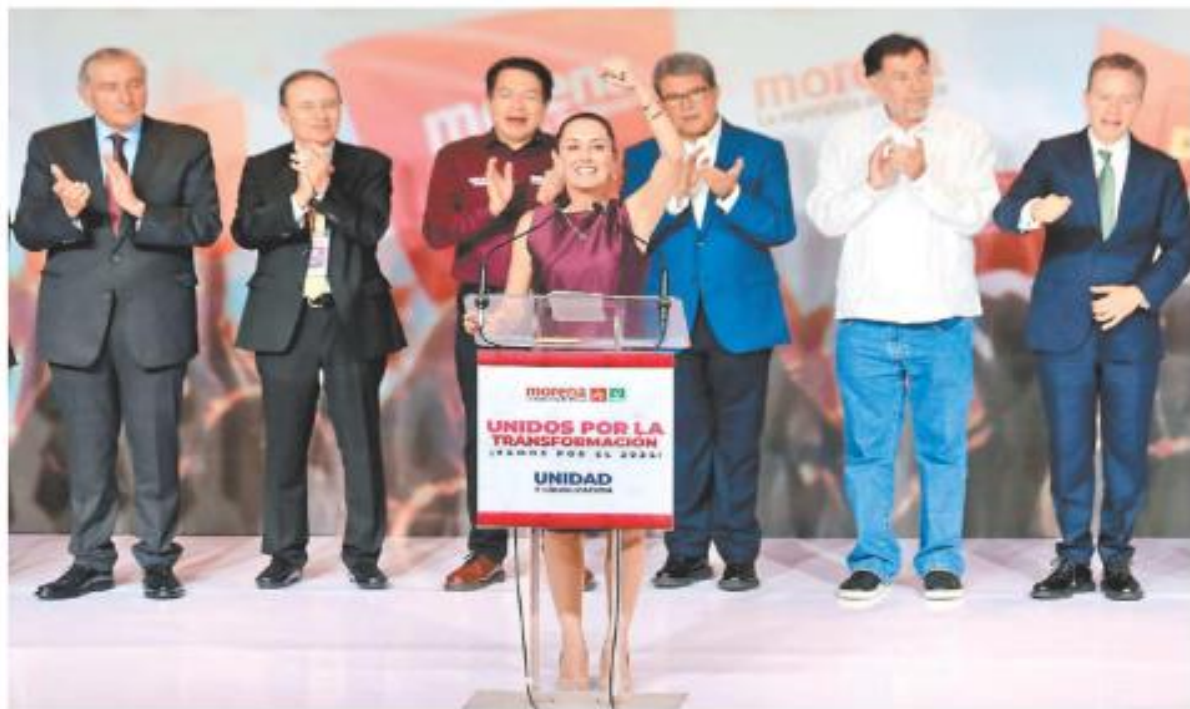
La ex jefa de Gobierno durante su discurso de triunfo ante otras corcholatas y miembros de la dirigencia partidista. JOBGE CARBALLO