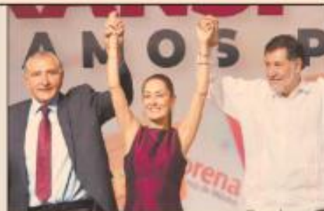
La elección de Gobierno de la CDMX fue recordada por sus aspirantes como quien encabezará la coordinación de la UT de cara a las elecciones en el 2024.

• Las encuestas de Morano y de los otros aspirantes favorecieron a Claudia Sheinbaum, quien iniciará de inmediato los trabajos. #Eco_38-39