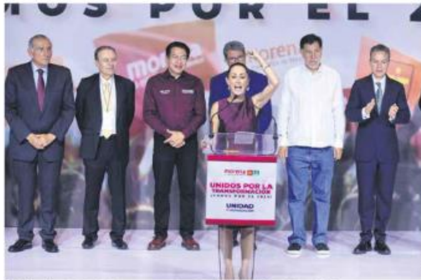
Duelo de mujeres. Claudia Sheinbaum competirá con Xóchitl Gálvez por la Presidencia en 2024.

Encuesta. Gana Claudia en preferencias para encabezar la defensa de la transformación; hoy inicia su carrera al 24