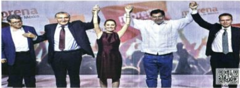
Cuatro de los seis aspirantes a la candidatura presidencial de Morena expresaron su respaldo a la ganadora Claudia Sheinbaum. Ricardo Monreal, Adán Augusto López, Gerardo Fernández Noroña y Manuel Velasco admitieron su derrota. Marcelo Ebrard descalificó el proceso y decidió asistir a la ceremonia donde se dieron a conocer los resultados de las encuestas.

El censo había comenzado sobre el mediodía, sorprendentemente, Marcelo Ebrard llegó a un salón de