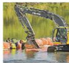
Texas apelarà del fallo. AP