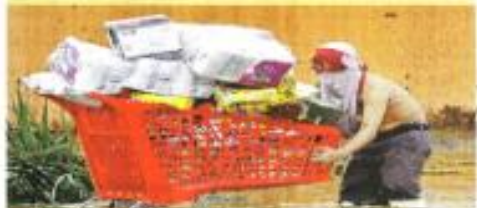
SAPITA. En medio de la tragedia, decenas de personas entraron a tiendas y plazas comerciales para comprar.

Recordó que los vientos eran muy fuertes y sus departamentos en sus muros parecían como si fueran por volar hacia el cielo. "Otis" en Guerrero, lo juro por Dios. La casa está destruida, mi baño se hundió y otros 700 dólares. El Club de Sales y la Marina (fraccionamiento) parece desahogado, una cosa horrible, pero estamos vivos", dijo alvado.