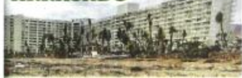
Decenas de hoteles y departamentos de lujo en la Zona Diamante fueron gravemente afectados y destruidos.