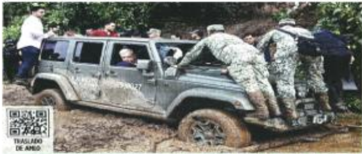
TRÁFICO DE AMO