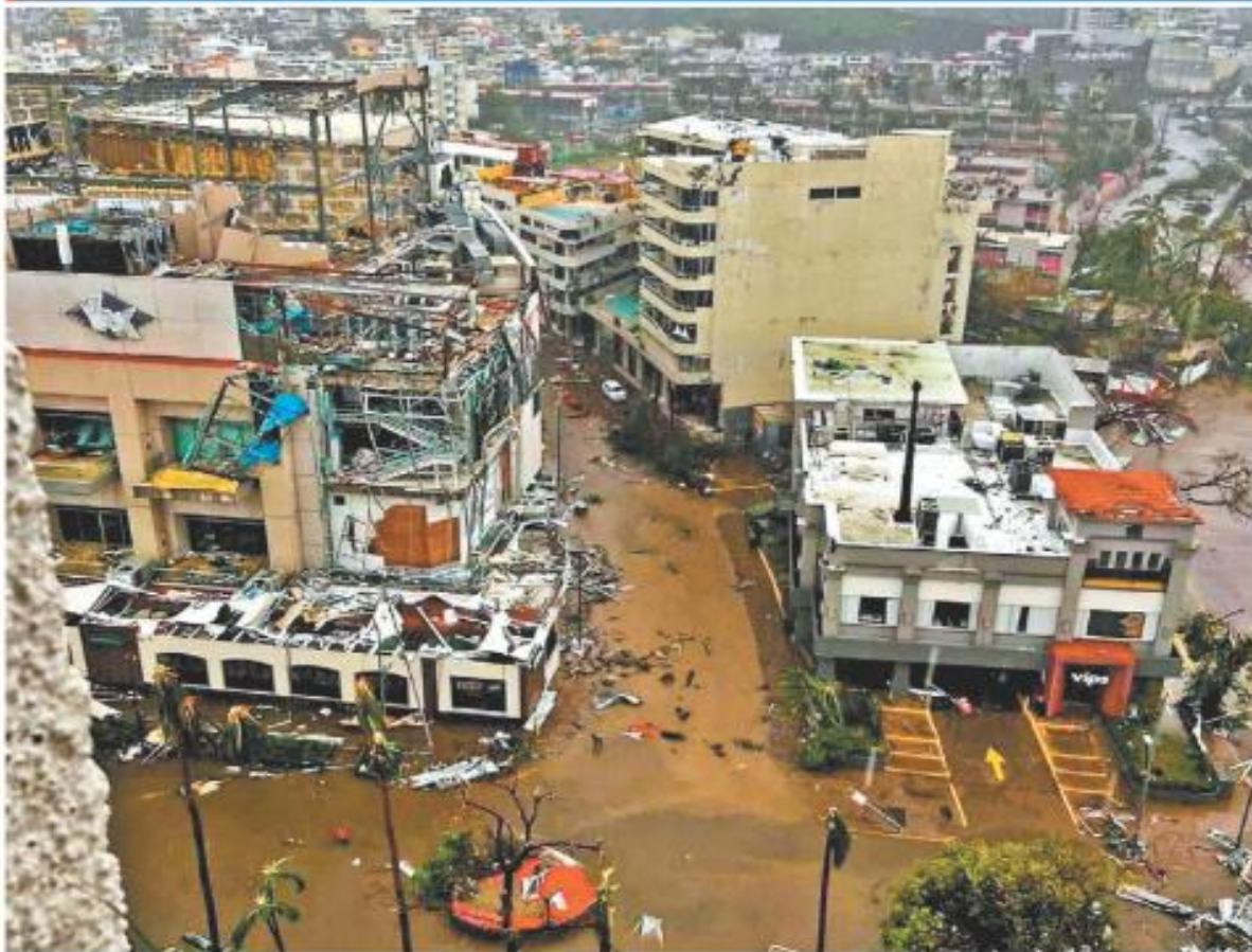
Los efectos catastróficos del fenómeno natural alcanzaron todo el puerto, incluidas las zonas exclusivas y las regiones altas. ESPECIAL

Acapulco. El huracán arrasa con hoteles, bares y negocios en la zona costera dejando también carreteras cerradas, crecidas de ríos y daños al agro; no se reportan decesos