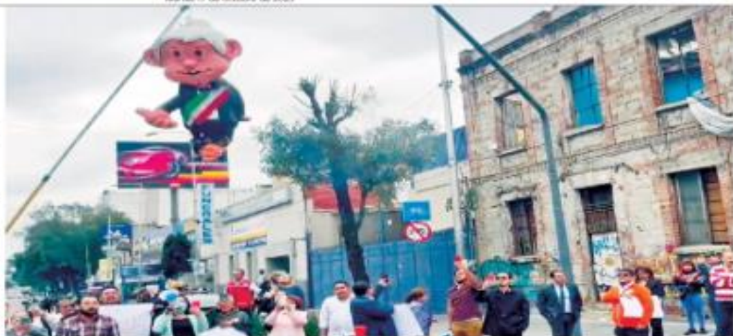
Una piñata con la figura de López Obrador fue colgada y quemada durante las protestas contra la reforma Judicialera, en la Ciudad de México.