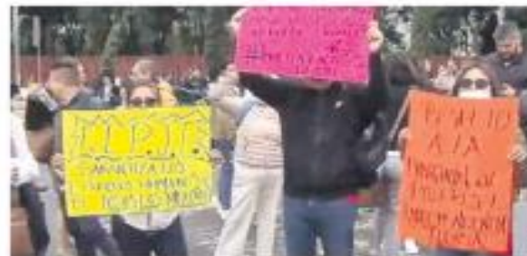
A las calles. Cerraron avenidas y realizaron bloqueos ante la eliminación de fondos.