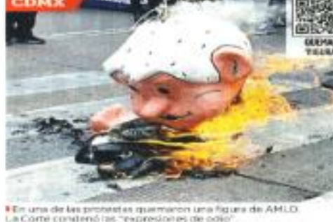
En una de las protestas quemaron una figura de AMLO. La Corte condenó las "expresiones de odio".