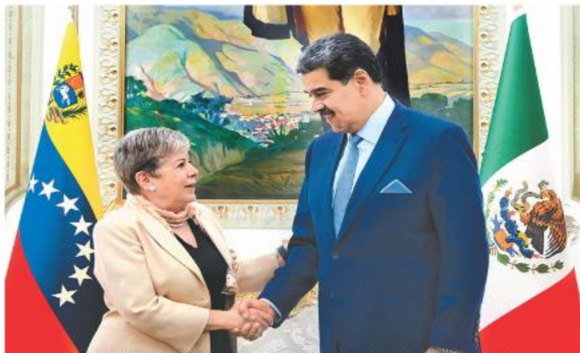
La canciller mexicana, Alicia Bárcena, invitó al mandatario venezolano, Nicolás Maduro, a la reunión regional en Palenque.

Inversión en Nuevo León Gigante chino traza parque industrial con 5 mil mdd E. MENDIETA Y F. MURILLO - PÁG. 17