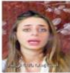
GLOBAL / PÁGINA 25

Asimismo, insistió a los países del mundo "a adherirse a sus compañías que no participen en el ejército enemigo".