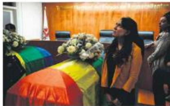
Despedida. El Tribunal Electoral reconoció la labor del magistrado como autoridad.

Destacó que probablemente hubo una discusión entre ambos. Tras acabar con la vida de Baena, Nieves se habría provocado una lesión mortal. Familiares de Baena rechazaron esta versión y sostienen que se trata de un crimen de odio y discriminación. —A. Flores / PÁG. 32