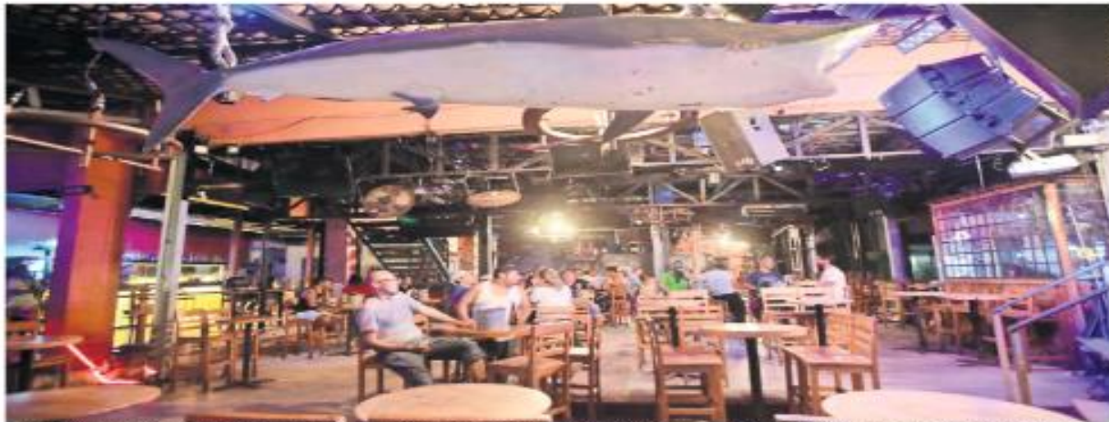
La noche del sábado algunos bares y restaurantes volvieron a iluminar la avenida Costero Miguel Alemán, aunque sin apoyo del gobierno, según algunos empresarios.