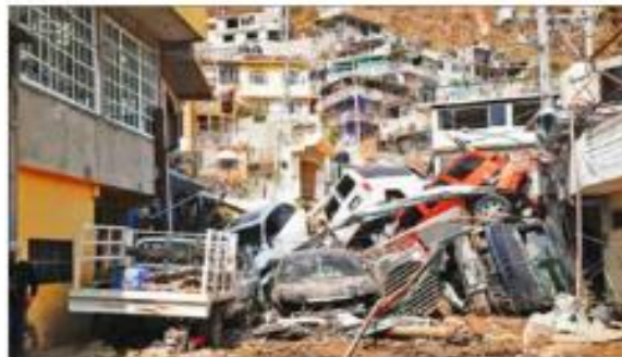
▲ Enormes destrozos causó Otis en las partes elevadas de la colonia Revolución del Sur, en el puerto de Acapulco.

B. CARBAJAL, E. MURILLO, S. OCAMPO Y N. JIMÉNEZ, ENVIADO / P 2 A 5 Y 32