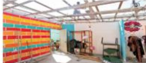
Algunos habitantes del pueblo de Acapulco y Coyula de Benítez ya comenzaron a rehabilitar sus viviendas y comercios.