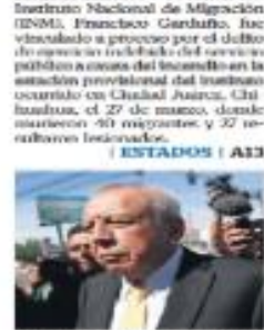
Francisco Garduño, Director del Instituto Nacional de Migración.

El titular del Instituto Nacional de Migración (INM), Francisco Garduño, fue vinculado a proceso por el delito de ejercicio indebido del servicio público a causa del incendio en la estación provisional del transporte ocurrido en Ciudad Juárez, Chihuahua, el 27 de marzo, donde murieron 40 migrantes y 27 resultaron lesionados. | ESTADOS | A23