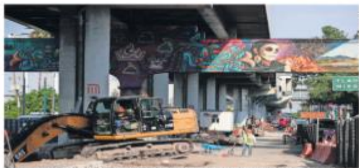
Pase el avance en las obras de reparación de la Línea 12 del Metro, aún no hay fecha de reapertura.

"Se tiene que suspender por parte de la empresa, por ejemplo, el cobro de las cuotas sindicales que están haciendo, y la empresa en ese momento tiene que adoptar una actitud de imparcialidad. Yo no puedo suspender con ese artículo, ya no puede darle preferencia, porque esa es la única manera de la dualidad en el momento en el que el contrato colectivo se da por terminado", dijo la funcionaria federal. | RACIÓN | A6