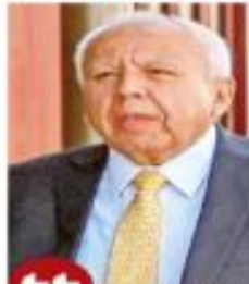
Francisco Garduño, titular del INM.

Francisco Garduño, comisionado del Instituto Nacional de Migración (INM), será juzgado por el delito de ejercicio indebido del servicio público y omisión en su deber, las cuales habrían propiciado la muerte de 40 migrantes en el incendio de marzo pasado en Ciudad Juárez.