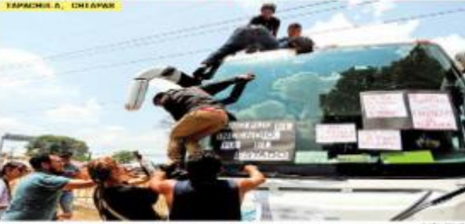
Activistas resucitan un camión en protesta por la tragedia. "No fue el fuego, fue el Estado", afirman.

La FGR solicitó las primeras cuatro órdenes de aprehensión por el incendio en la estación migratoria en Ciudad Juárez que ha dejado 39 muertos y 27 heridos, 24 de ellos graves. Rosa Icela Rodríguez, secretaria de Negocios Federales, detalló que ya determinaron ocho presuntas responsabilidades de la tragedia, entre ellos cinco elementos de la empresa de seguridad que custodiaban la estación, dos agentes federales y uno del Instituto Nacional de Migración (INM). Aseguró que en la investigación no se permitirá a ningún funcionario y lamentó que durante el incendio no se respetaron protocolos. "En lugar de salvar las vidas, nos hacen capaces de abrir una raja", señaló en conferencia. Destacó que la tragedia no representa a la política migratoria del gobierno federal, y servirá para mejorar el trato a los migrantes en esas instalaciones.