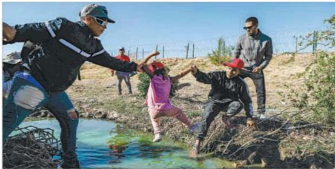
▲ Alrededor de 300 migrantes cruzaron ayer el río Bravo, en los límites de Ciudad Juárez y El Paso, Texas, tras el rumor de que las solicitudes de asilo serían aceptadas debido al incendio que provocó la muerte de indocumentados en una estación del INM.

GUSTAVO CASTILLO, ALONSO URRUTIA Y EMIR OLIVARES; JESÚS ESTRADA Y RUBÉN VILLALPANDO, CORRESPONSALES / P 2