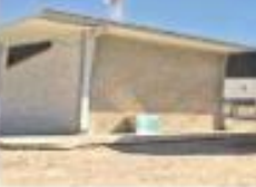
El taller con refrigeración que fue recortado ante la saturación del Semáforo municipal está apagado, con el Grupo Imagen. / Foto: Elizabeth Velasco

se trabaja por delitos como homicidio doloso, daño en propiedad ajena, abuso de autoridad y lesiones. Aclaró que se seguirá