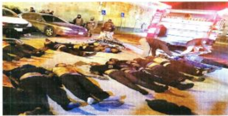
Los cuerpos de los migrantes muertos fueron colocados en helixes afuera de la sede del INM en Ciudad Juárez.

Conforme reportes preliminares, el incidente ocurrió luego de que migrantes, principalmente venezolanos, protestaban ante empleados del INM. En medio de las protestas comenzó un incendio en la zona de los baños del área reservada para hombres que