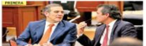
Lorenzo Córdova dice adiós

Al despedirse de la Junta General Ejecutiva, el ex presidente del INE agradeció a directores y trabajadores del organismo su "compromiso y valentía". / 8