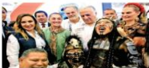
TIANGUIS TURÍSTICO 2023