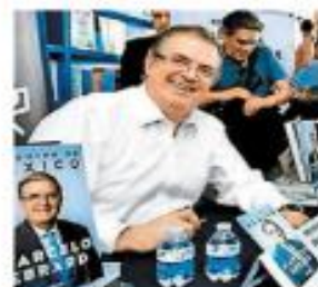
El canciller.

La gente aún no vota, responde Marcelo Ebrard sobre la invitación de Claudia Sheinbaum a su eventual gabinete. PÁG. 8