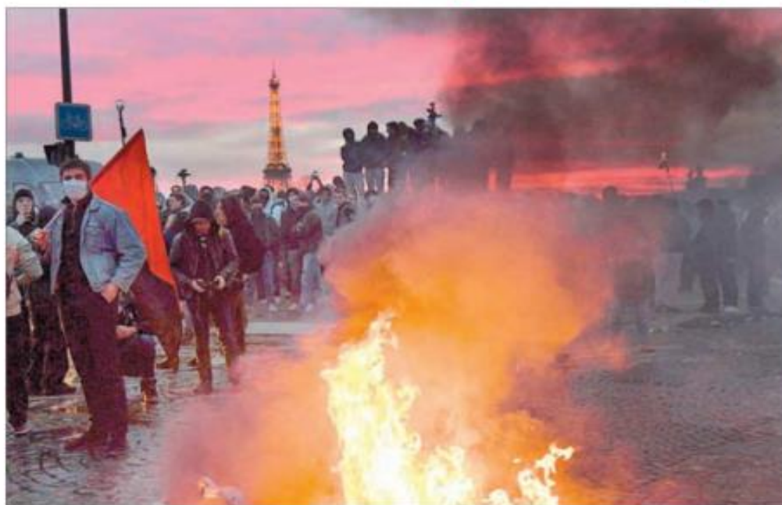
▲ Las protestas se extendieron por las calles de París, Nantes, Lille, Marsella, Lyon, Burdeos y otras ciudades. La reforma del presidente