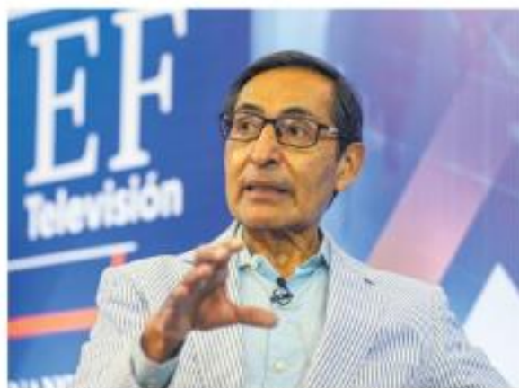
CONVENCIÓN. 'Nuestro mensaje es que estamos haciendo las cosas bien'