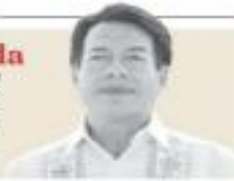
Mario Delgado "Lázaro Cárdenas y López Obrador, dos visionarios" - P. 14