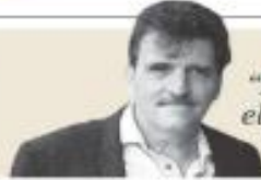
Enrique Serna "Pacheco, Monsiváis y el arte de la persuasión a la japonesa" - P. 29

Estudio. Con base en estadísticas de gobierno y organizaciones de EU, la SRE alega que solo 3 por ciento de detenciones involucra a los migrantes en ese contrabando