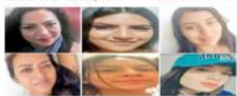
Las edades de las víctimas de desaparición van de los 19 a los 48 años, autoridades han invitado proporcionar más datos del caso.

De acuerdo con el colectivo de búsqueda Una promesa por cumplir, cinco de las mujeres estaban en una fosa clandestina en el municipio de Juventino Rosas. Primera | PÁGINA 12