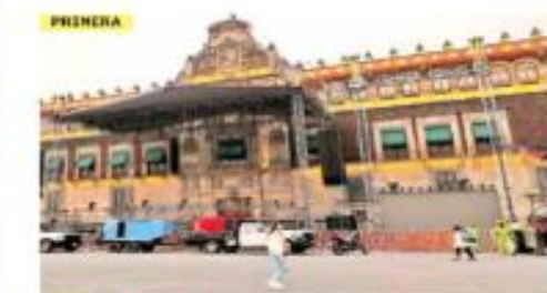
AFINAN DETALLES