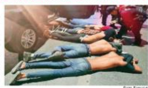
Los cinco hombres estaban malheridos y fueron abandonados en calles cercanas al centro de Matamoros, Tamaulipas.

POR ISABEL GONZÁLEZ Y ENRIQUE SÁNCHEZ Los gobiernos de México y Estados Unidos lanzarán una campaña bilateral "sin precedentes" contra el fentanilo. Luego de una reunión en Palacio Nacional entre funcionarios de seguridad de ambos países, el canciller Marcelo Ebrard insistió que se combata en la necesidad de realizar más acciones, de manera conjunta, para combatir el tráfico y el consumo de drogas. Detalló que la campaña se enfocará en informar a los jóvenes que significa el fentanilo, por qué es una amenaza y un peligro para todas las familias. Ebrard rechazó que haya tensión en la relación bilateral, luego de que legisladores republicanos han presentado iniciativas para que militares combatan a los cárteles de la droga. Explicó que esas acciones no son realizadas o impulsadas por funcionarios de la administración Biden, sino que se trata de una "campaña unilateral" de los republicanos. PRIMERA / PÁGS. 16 Y 17