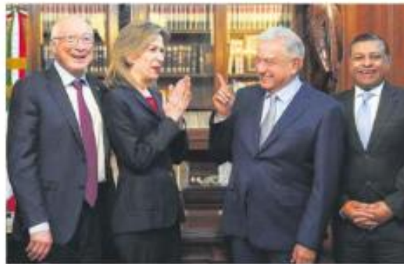
En Palacio. AMLO recibió a Elizabeth Sherwood-Randall, consejera de Seguridad.

El presidente AMLO rechazó y calificó como "invasión" las propuestas de senadores republicanos para combatir a cárteles mexicanos con el Ejército de EU, al tiempo que acusó a ese partido de corrupto.