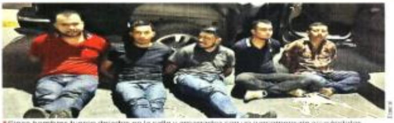
«Cinco hombres fueron despidos en la calle y amarrados con un mensaje acusándolos de ser los asesinos y homicidas de los narcoamericanos».

Ante la propuesta de legisladores republicanos de una acción militar de Washington en territorio mexicano, el Presidente Andrés Blandino López Obrador arremetió con perfil a congresales en Estados Unidos no votar por el Partido Republicano. "Si no cambian su actitud y piensan que van a utilizar a México por sus propios intereses prosaicos, electorales, políticos, económicos, vamos a buscar a que no se vote por ese partido", advirtió el Mandatario mexicano desde su conferencia matutina. López Obrador criticó la iniciativa impulsada por los legisladores republicanos Lindsay Graham y Dan Claitor para que el Ejército de Estados Unidos, comente a los militares de la droga en México.