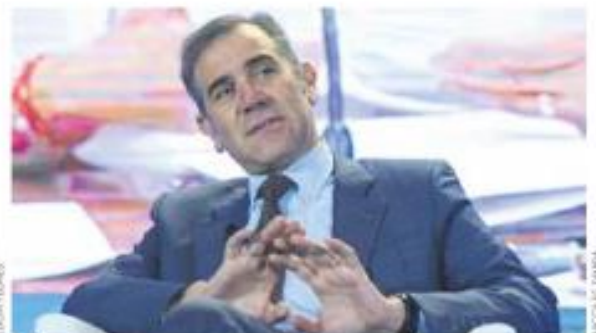
Córdova. Estamos ante una simulación de quienes pueden ocupar candidaturas.