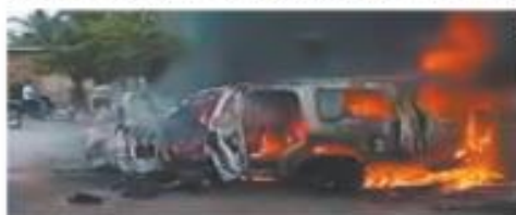
Tres chiapanecas a la contienda, los criminales le prendieron fuego.