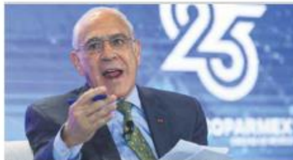
Gurría. En México no necesitamos un presidente omnipotente.

CRECE 2% ECONOMÍA DE EL MÁS DE LO PREVISTO, POR EXPORTACIONES Y CONSUMO. ECONOMÍA / PÁG. 9