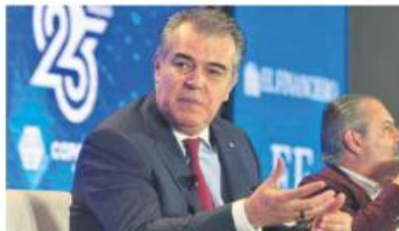
Cervantes. Pudimos superar los retos económicos de la pandemia por el T-MEC.