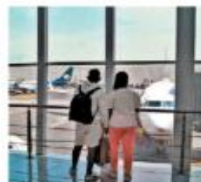
Turistas nacionales. ESPECIAL

ROBERTO VALADÉZ, CIUDAD DE MÉXICO Más de un millón de mexicanos visitaron diversos países por la fortaleza del peso ante otras monedas, según Inegi. PÁGS. 5