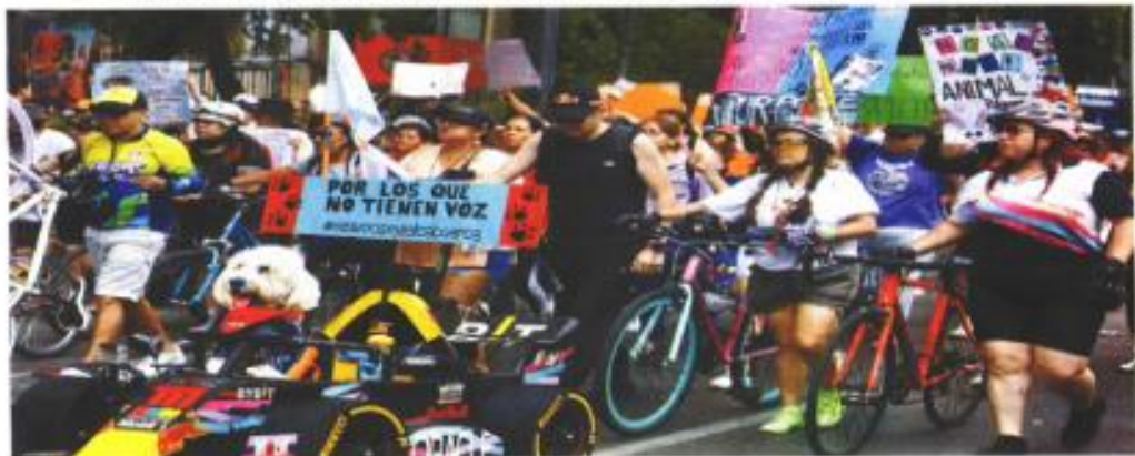
CDMX.— Integrantes de colectivos y ciudadanos marcharon ayer del Ángel de la Independencia al Zócalo capitalino en protesta contra la crueldad hacia los animales. Demandaron mejores leyes para los "seres sintientes" y pidieron concientizar a niños y jóvenes de no causar daño a los seres vivos. METROPOLI | A33