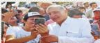
ADÁN PIDE A MORENA QUE DONE LOS 5 MDP PARA MEJORAR CENTROS DE SALUD