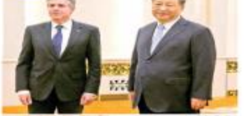
ENCUENTRO EN PEKÍN