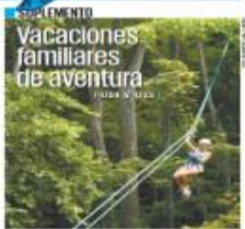
Vacaciones familiares de aventura