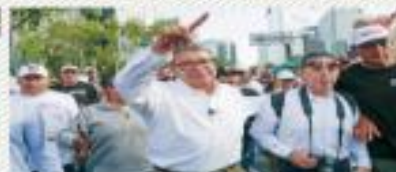
MONREAL PROMETE RECONCILIAR A LOS MEXICANOS Y PONER FIN A HOSTILIDADES