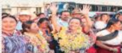
SHEINBAUM DICE QUE PONDRÁ SU SELLO A LA TRANSFORMACIÓN DEL PAÍS