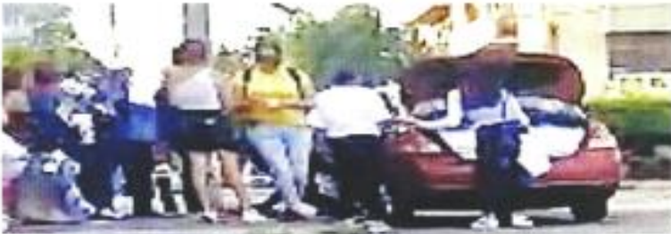
El reparto de dinero ocurrió a unos cuantos del salón del ex-Secretario de Gobernación.