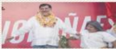
FERNÁNDEZ NOROÑA BUSCA REFORMAR LA CONSTITUCIÓN Y EL PODER JUDICIAL