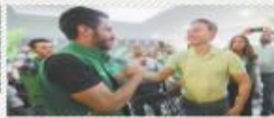
VELASCO VA POR MANDO ÚNICO Y DAR SEGUIMIENTO AL TRABAJO DEL PRESIDENTE