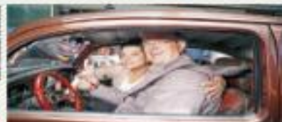
EBRARD PROPONE CREAR LA SECRETARÍA DE LA 4T Y QUE LA DIRJA HJO DE AMLO