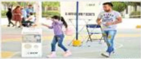
En Tepic, algunos votos acompañaron a los adultos y a los niños.