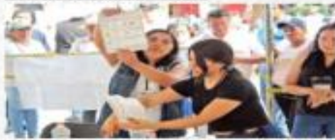
Una castillera en Los Mochis después de cerrar el conteo de votos.