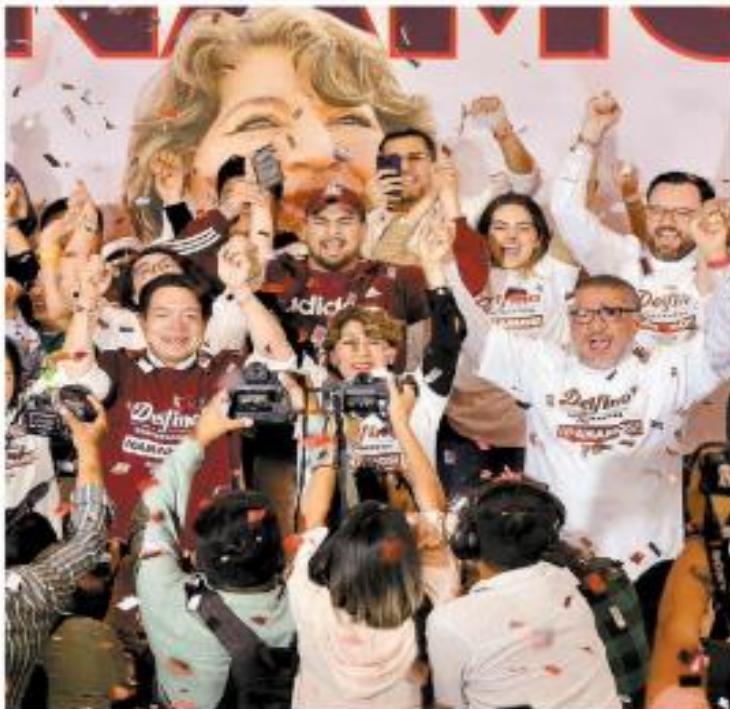
La candidata morenista gana el gobierno en su segundo intento. ARIEL OJEDA