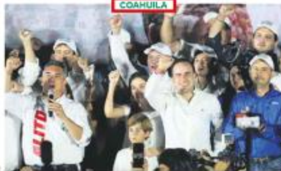
Gobernar para todos. Llama el coahuilense a la unidad y el trabajo en equipo.