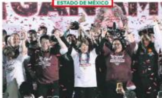
Marca participas. Anuncia maestra el inicio de la transformación en Edomex.