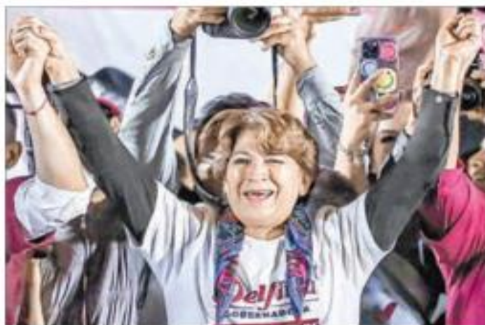
▲ Delfina Gómez celebra su victoria en la Plaza de los Mártires, en Toluca. Al cierre de edición, tenía 53.1 por ciento de votos por 43.9 de su adversaria.