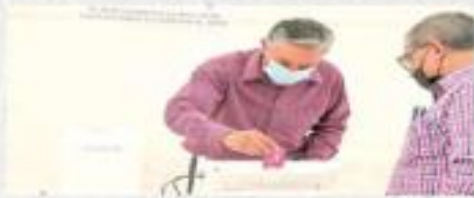
Los mexicanos votaron por primera vez en urnas electrónicas.