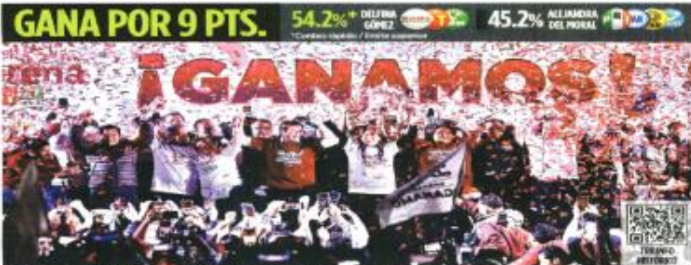
Delfina Gómez ganó ayer la Gubernatura del Estado de México, que durante décadas fue controlada por priistas del Grupo Atlacomulco.