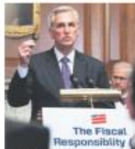
Suerte efecto. El pacto cerrado entre Biden y McCarthy obtuvo respaldo.