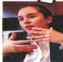
La presidenta del Instituto Electoral Mexiquense, Claudia Pineda, asegura a este diario que el proceso está limpio y al otro día habrá | A22

AMLO ACUMULA 135 QUEJAS POR VIOLAR LA LEY ELECTORAL