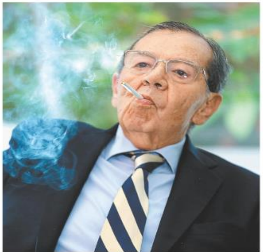
La clase política nacional reconoció sus aportaciones a la democracia. JOSÚS QUINTANAHI

"Es hora de un chiapaneco en la Presidencia": Velasco LILIANA COLLADO - PÁG. 11