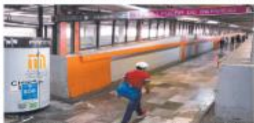
Desde el 1 de julio del año pasado, 12 de las 30 estaciones de la Línea 1 del Metro permanecen cerradas por modernización.

Por lo anterior, las estaciones de Puente de Alvarado y Agua con Color aún se están