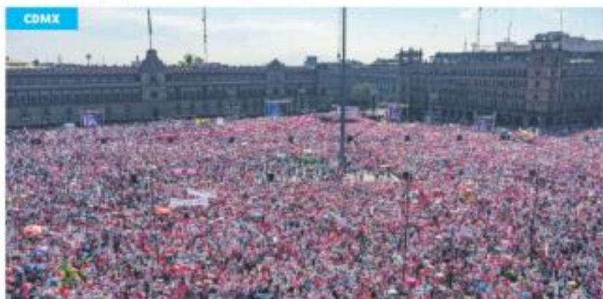
Otros datos. Mientras los organizadores calcularon una asistencia de 500 mil, el gobierno de la CDMX dijo que fueron 90 mil.

'Ola rosa'. Reportan organizadores la asistencia de 500 mil personas; replican movilizaciones en más de 100 ciudades