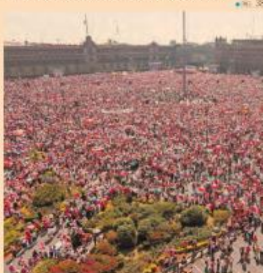
Miles de ciudadanos se concentraron ayer en el Zócalo de la CDMX y en otras ciudades, para oponerse a la reforma electoral.

• Tras la aprobación de la reforma electoral conocida como Plan II, y más allá de las manifestaciones en contra realizadas ayer en decenas de ciudades, el caso está en manos de la SCJN.