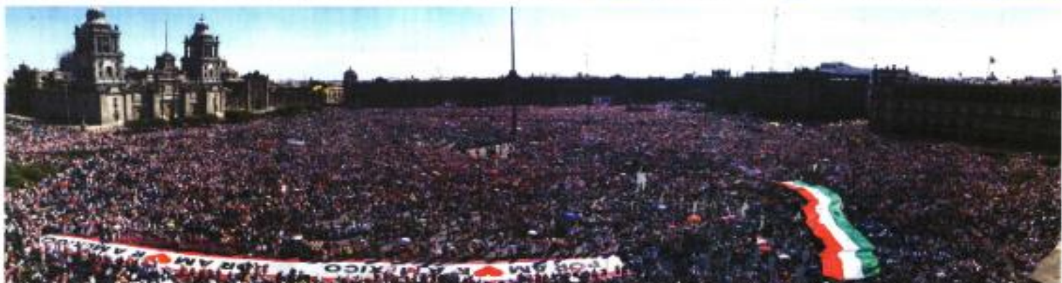
De tanto que los organizadores de la marcha por la defensa del INE ultimaron en unas 500 mil los adherentes al Zócalo, la Secretaría de Seguridad capitalina estableció la cifra en apenas 90 mil.

Cientos de miles lo arrojaron la casa a López Obrador Héctor de Mauleón Opinión A5