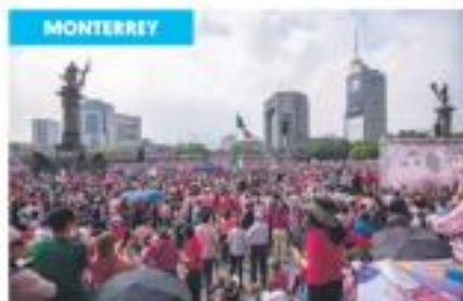
Las Tlax. En la Macroplaza unas 35 mil personas se reunían.