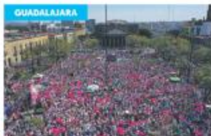
Plaza Libertadón. Congregó a más de 20 mil desde temprano.