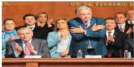
El presidente Andrés Manuel López Obrador encabezó la ceremonia por el 106 aniversario de la Constitución, en Querétaro.