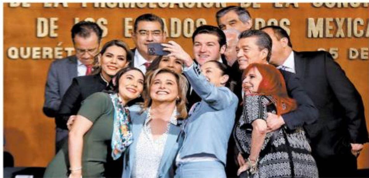
Claudia Sheinbaum organizó la selfi entre gobernadores asistentes a la ceremonia.