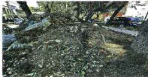
Estado de una de las obras modificadas por la Alcaldía.

La Sedena también agusta por 15 camionetas SUV con blindaje Nivel V Plus, el cual soporta ataques con balas de calibre 7.62, por un costo de entre 50 y 70 millones de pesos.