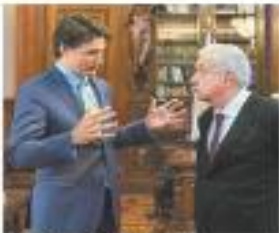
En Palacio Nacional. ESPECIAL

Hace un año, Canadá y México presentaron una queja contra Estados Unidos sobre cómo aplicar los requisitos de contenido del sector automotor en el T-MEC y, según el fallo, la interpretación de EU de las normas es "inconsistente". PÁGS. 6V7