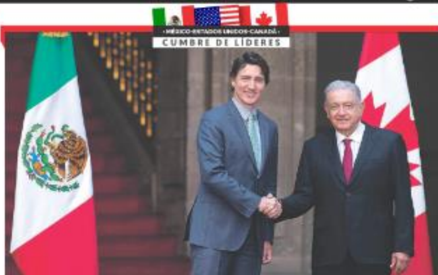
MÉXICO-ESTADOS UNIDOS-CANADÁ CUMBRE DE LÍDERES

ALIADOS. Justin Trudeau dijo que tanto Canadá como México son países progresistas y aportarán a la prosperidad.