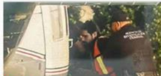
TRASLADO. Ya en la CDMX, estuvo en la FGR antes de ser llevado al Altiplano.