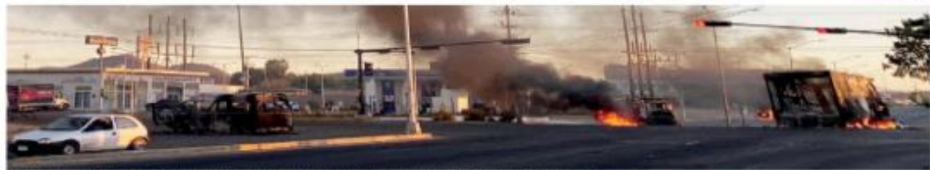
Tirados y quemados de vehículos se registraron ayer en Culiacán, Sinaloa, tras el operativo en el que fue detenido Ovidio Guzmán.