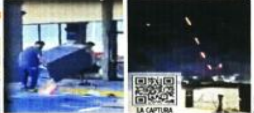
Tras un ataque por aire y tierra fue detenido Ovidio Guzmán, lo que desató actos de terror y vandalismo.