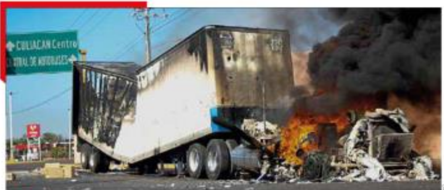
SALDO. Sinaloa reportó que hubo 18 personas heridas, sin muertos, pero extraoficial se reportaron de 2 a 4 fallecidos.