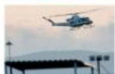
Helicóptero en el que Ovidio fue llevado a El Albatraz.