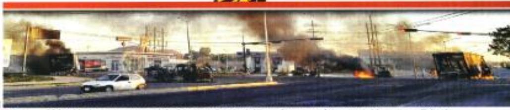
Al menos 200 vehículos, entre autos particulares, camiones y tráileres, fueron usados en narcobloqueos en Culiacán.