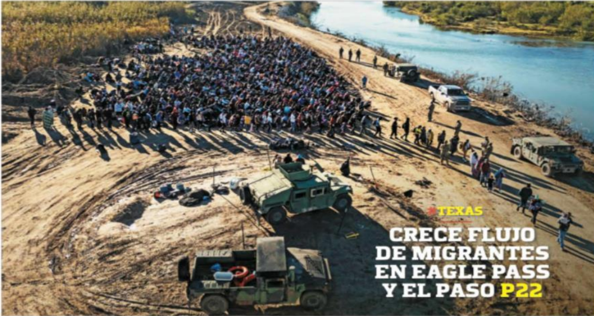
TEXAS CRECE FLUJO DE MIGRANTES EN EAGLE PASS Y EL PASO P22