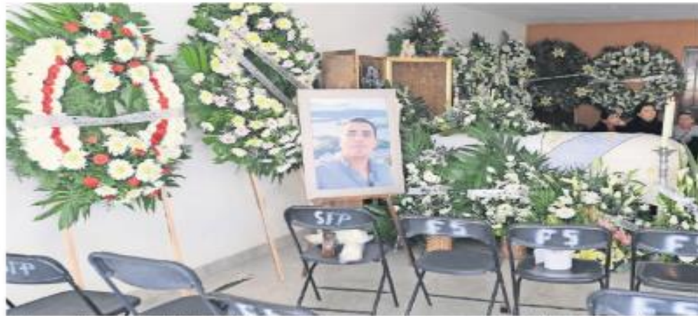
Familiares permitieron a la fotoperiodista de EL UNIVERSAL, tomar imágenes, pero se salieron para no aparecer, ante el riesgo a represalias de los asesinos.