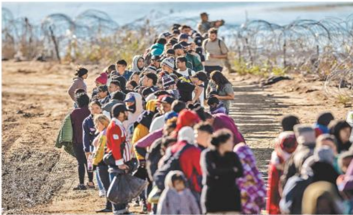
Autoridades de EU calculan que hasta 12 mil migrantes cruzan por la línea divisoria de Eagle Pass.