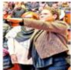
El pleno del Senado le tomó protesta a Lenta Batres.

En la exposición que hizo ante el pleno la madrugada del jueves, antes de las dos rondas de votación en las que la oposición rechazó la terna enviada por el Ejecutivo federal para ocupar la vacante que dejó Arturo Zaldívar.