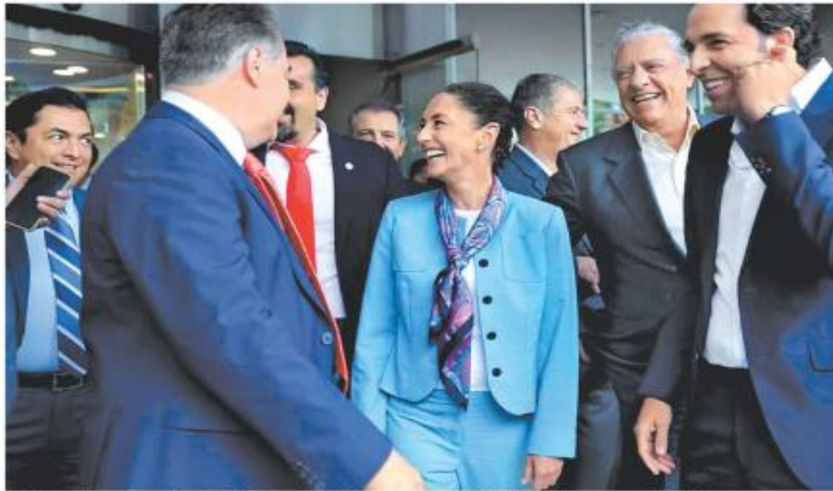
Claudia Sheinbaum destacó ante la cúpula nacional del CCE la importancia de la inversión, pero también del bienestar. ESPECIAL

Recorrido por Hidalgo Condena Adán mojigatería y añoranza por Maximiliano GUADALUPE TREJO - PÁGS. 10 Y 11