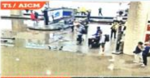
ATLAMAYA / AO