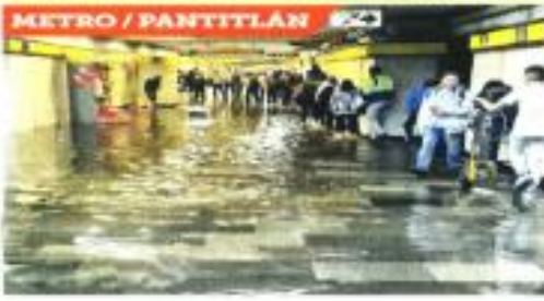
METRO / PANTITLÁN

Diversas inundaciones y fuertes daños materiales se registraron tras la tormenta que azotó a la CDMX ayer por la tarde. Incluso, se reportó el desmoronamiento de la Plaza Bessera, ubicada en la Alameda Álvaro Obregón, que provocó daños en varios coches y comercios. El fraccionamiento Atlamaya ubicada cerca de Álvaro tuvo inundaciones de dos metros. Otras colonias como Tepicón San Ángel y Jardines del Pedregal, también registraron inundaciones. Por último, sur quedó colapsado por distintos enchufamientos. En el norponiente hubo severas afectaciones, como en Interlomas y otras colonias de Huisquilucan. El impacto de la lluvia alcanzó en el oriente, a la Terminal I del Aeropuerto Internacional de la Ciudad de México y varias estaciones del Metro, como la de Pantitlán.