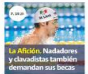
La Afición. Nadadores y clavadores también demandan sus becas

Cinco de los nueve precandidatos presidenciales republicanos han manifestado su apoyo al bombardeo a los cárteles mexicanos de la droga en la frontera y son enemigos de la migración, temas que dominarán su debate mañana, boicoteado con la ausencia de Donald Trump. PÁG. 17