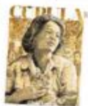
ILUSTRACIÓN: GUSTAVO A. ORTEGA