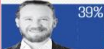
Santiago Taboada (PAN PR-PRC)