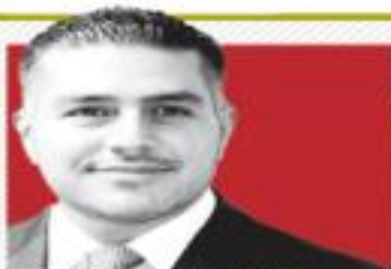
Oscar García Harfuch (Morena PT-PVEM)