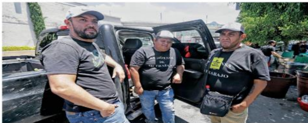
Operadores del transporte público de pasajeros del Estado de México vistieron playeras negras con la leyenda "En defensa de mi trabajo".